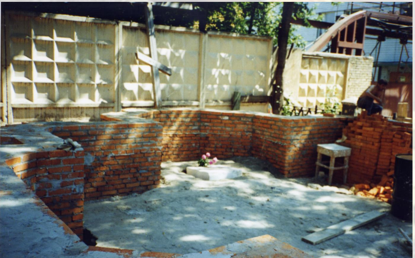
Освящение закладного камня в основание строящегося храма-баптистерия. В день памяти св. равноапостольных царя Константина и матери его царицы Елены 3 июня 1995 г. при значительном стечении народа проходило освящение закладного камня.