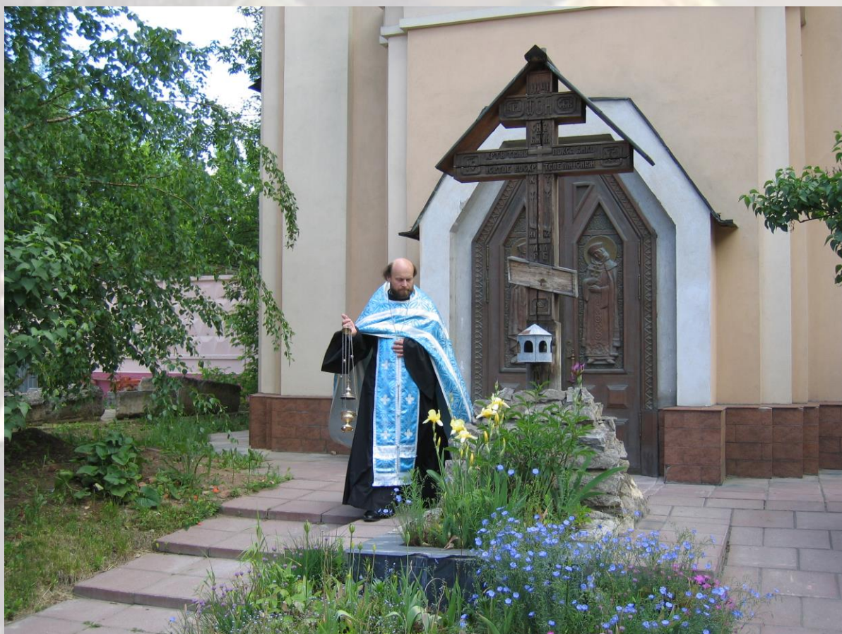
Торжественный молебен на десятилетие освящения закладного камня храма-крестильни состоялся 3 июля 2005 года в день памяти св. царей Константина и Елены.