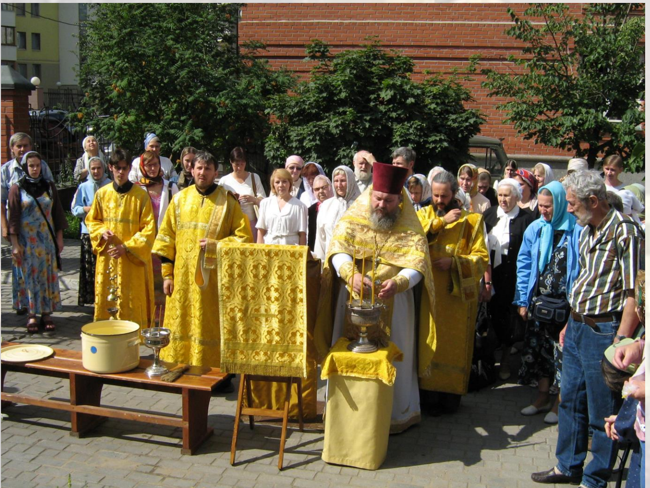
Молебен у Храма-крестильни св. равноапостольной Ольги 24 июля 2006 г.