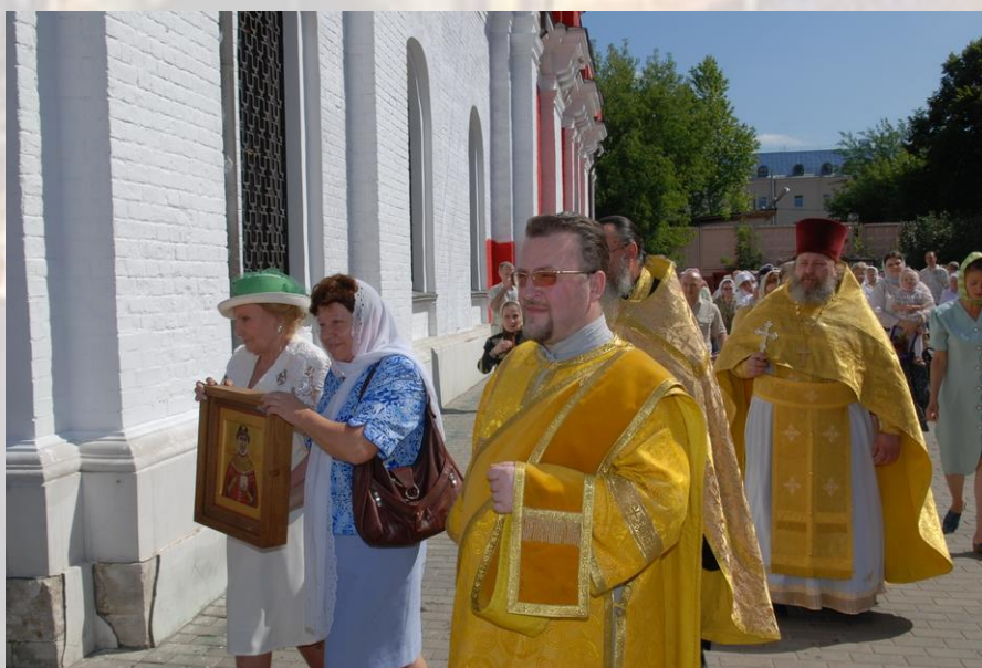
Праздничная Литургия, крестный ход и молебен у Храма-крестильни св. равноапостольной Ольги 24 июля 2008 г.