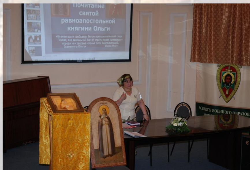
Круглый стол «Современное осмысление жизни и деяний святой равноапостольной княгини Российской Ольги», проходивший в рамках празднования дня памяти святой равноапостольной княгини Ольги 24 июля 2008 г.