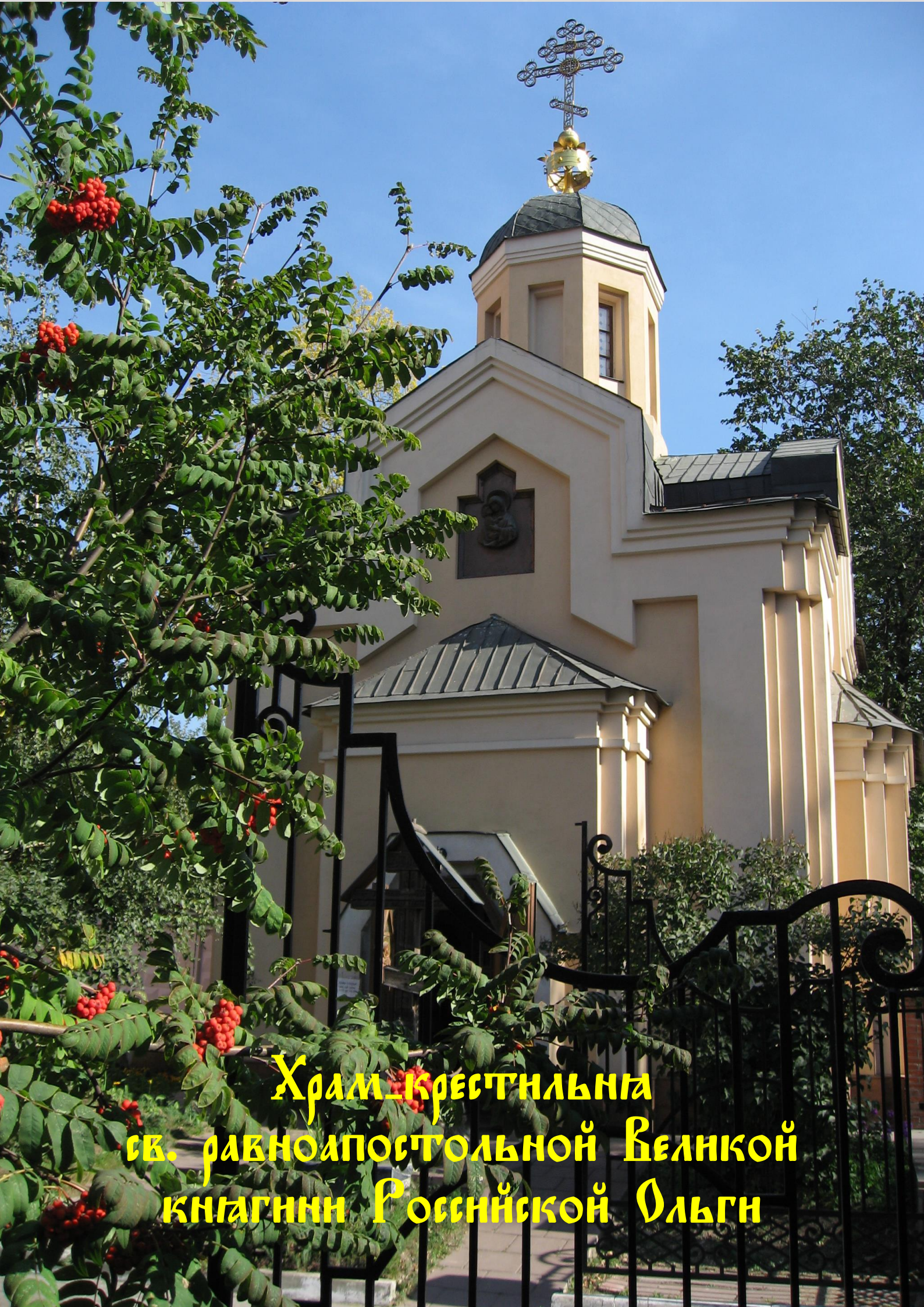
Храм Крестильни св. равноапостольной Великой княгини Российской Ольги