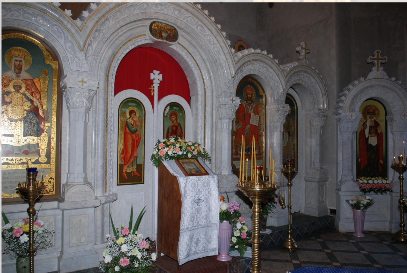
Внутренний вид храма часовни на момент открытия и в 2008 г.

С 24 июля 2005 г. строящийся храм св. Ольги открыт для молящихся ежедневно с 9.30 до 16.30.