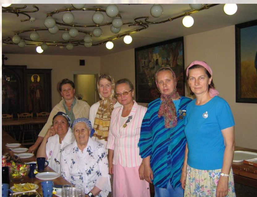
Молебен у Храма-крестильни св. равноапостольной Ольги и трапеза для кавалеров ордена св. Ольги 24 июля 2007 г.